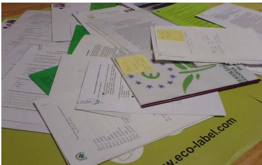
2.attēls. Vidusskolnieku iesūtītie darbi konkursam „Par produktiem un pakalpojumiem ar „zaļo” zīmi”.

dalību ekomarķējuma programmu regulējošo Eiropas Savienības normatīvo aktu izstrādes procesā. Atskaites periodā iegūta jauna pieredze, sagatavojot nacionālās pozīcijas par Eiropas Komisijas priekšlikumu Eiropas Parlamenta un Padomes Regulai, ar ko nosaka prasības Kopienas ekomarķējuma programmai, kā arī nodrošināta dalība un sagatavotas arī instrukcijas dalībai Eiropas Padomes darba grupas sanāsmēs. Papildus atskaites gadā Birojs uzsāka ekomarķējuma programmas popularizēšanas un izpratnes par videi draudzīgu patēriņu veidošanas pasākumus, kā arī aktīvi piedalījās Eiropas Savienības ekomarķējuma kompetento iestāžu foruma, starptautiskās Ekomarķējuma Padomes un Regulācijas komitejas darbā. Kā vienu no nozīmīgiem 2008.gadā paveiktajiem darbiem ekomarķējuma programmas koordinācijas jomā noteikti jāmin Latvijas vidusskolnieku mērķauditorijai organizēto konkursu „Par produktiem un pakalpojumiem ar „zaļo” zīmi”. Konkursa mērķis bija veicināt skolēnu izpratni par „zaļo” domāšanu, rosinot dalīties zināšanās un pieredzē, kā rezultātā savas idejas, domas un pārdomas esejas formā iesūtīja vairāku skolu 10.-12.klašu skolnieki no visiem Latvijas reģioniem. Šajā diskusijā ar prieku bija secināms, ka skolnieki grib domāt, ir gatavi domāt un domā. Ir nepieciešams tikai aizsākt tēmu par ikdienas rīcības ietekmi uz vidi, - un sarunu jaunieši turpina jau paši.